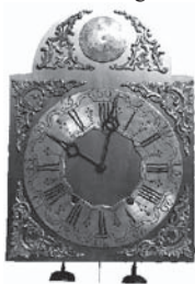
Horloge de style Liégeois