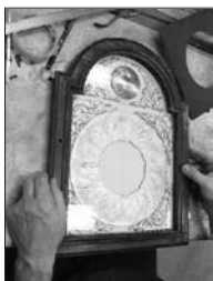
Fabrication de cadrans style Liégeois