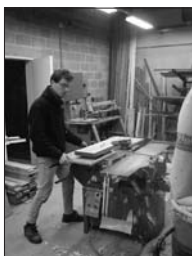
Fabrication du meuble de l'horloge